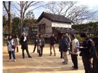
岡本民家園の見学