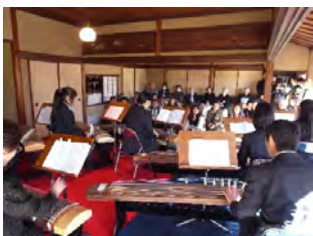
箏曲演奏の会場の様子