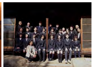
参加協力して下さったみなさん