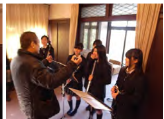
来場者と演奏した生徒の会話