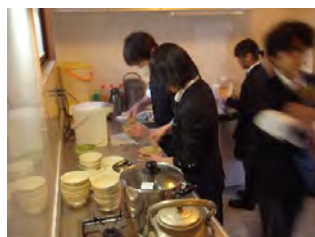
台所で抹茶を点てる生徒たち