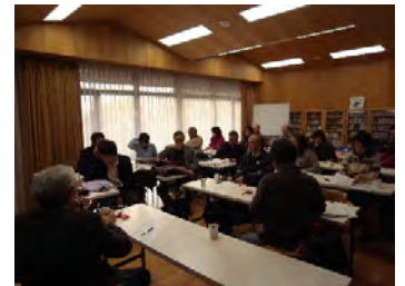
松本記念音楽迎賓館での話し合い