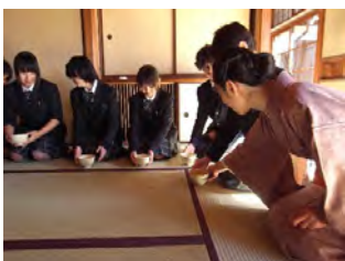
お茶の作法を習う生徒たち