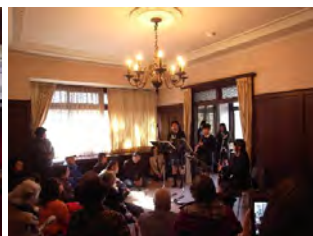
吹奏楽の会場の様子